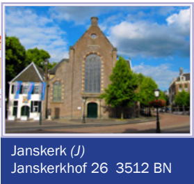
Janskerk (J) Janskerkhof 26 3512 BN