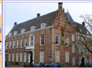
Paushuizen (P) Kromme Nieuwegracht 49 3512 HE