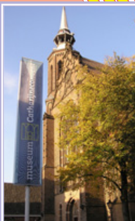
Museum Catharijne Convent (M) Lange Nieuwstraat 38 3512 PH