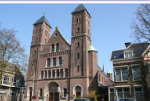
Kathedraal Ste Gertrudis en zalencentrum In de Driehoek (G) Willemsplantsoen 2, 3511 LA