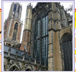
Domkerk (D) Domplein 3512 JN