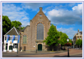
Janskerk (J) Janskerkhof 26 3512 BN

estkerk LANGE KOESTRAAT VREDENBURG Muziekcentrum Vredenburg