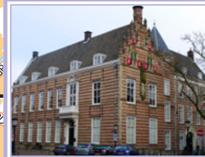
Paushuize (P) Kromme Nieuwegracht 49 3512 HE