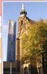
Museum Catharijne Convent (M) Lange Nieuwstraat 38 3512 PH