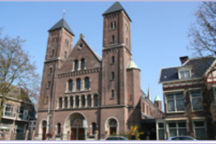
Kathedraal Ste Gertrudis en zalencentrum In de Driehoek (G) Willemsplantsoen 2, 3511 LA