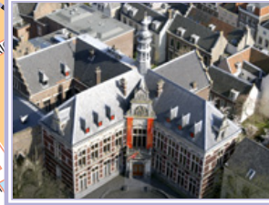
Academiegebouw (A) Domplein 29 3512 JE