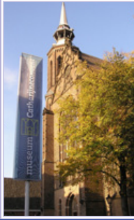
Museum Catharijne Convent (M) Lange Nieuwstraat 38 3512 PH