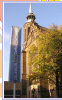
Museum Catharijne Convent (M) Lange Nieuwstraat 38 3512 PH