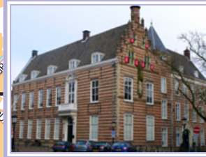
Paushuizen (P) Kromme Nieuwegracht 49 3512 HE