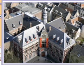
Academiegebouw (A) Domplein 29 3512 JE