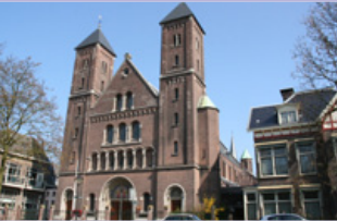
Kathedraal Ste Gertrudis en zalencentrum In de Driehoek (G) Willemsplantsoen 2, 3511 LA